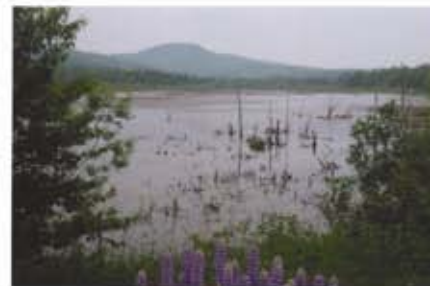
Aux alentours de l'étang